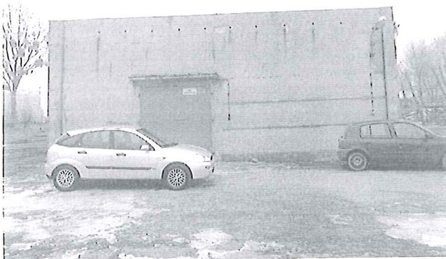
Zdjęcia nr 2. Elewacja boczna – stan istniejący.