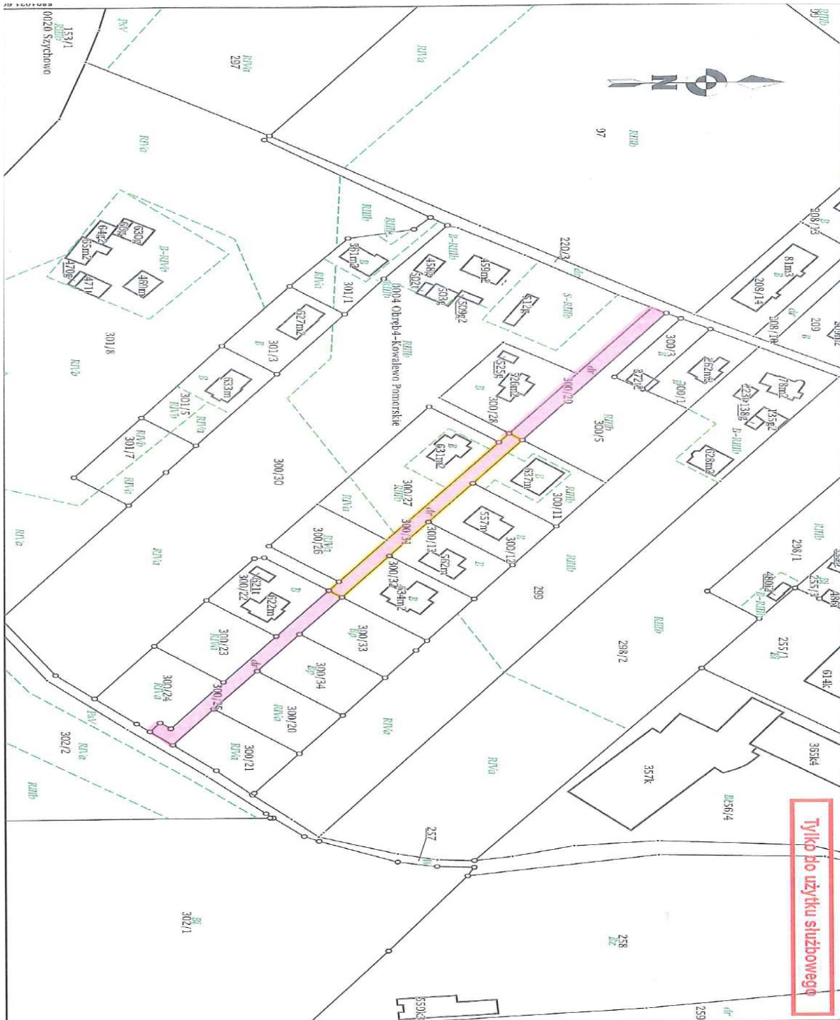
2. 04 obręb ewidencyjny miasta Kowalewo Pomorskie: dz. o nr geod. 300/29, 300/31, 300/25