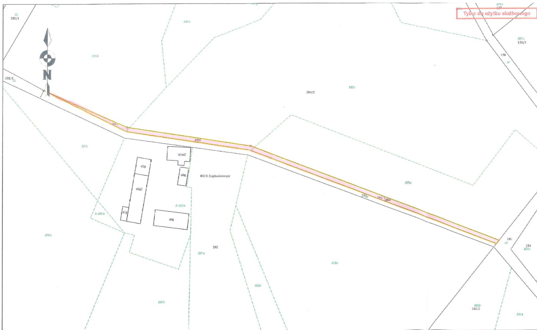
2. obręb ewidencyjny Zapłuskowęsy: dz. o nr geod. 284/1