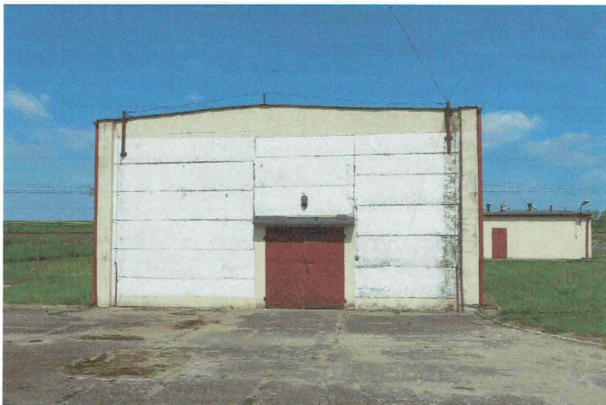
Fot. 3. Ogólny widok elewacji budynku.