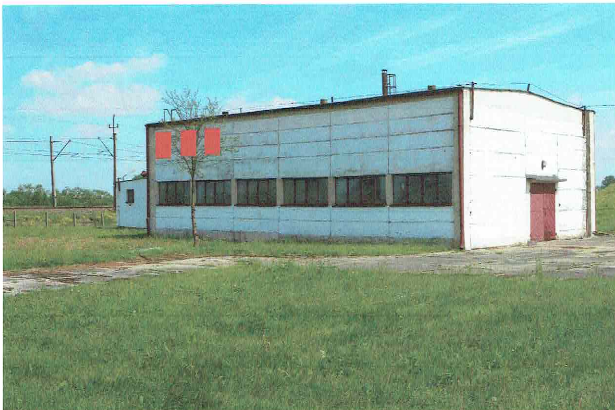
Fot. 6. Optymalne miejsca montażu budek lęgowych typu A.