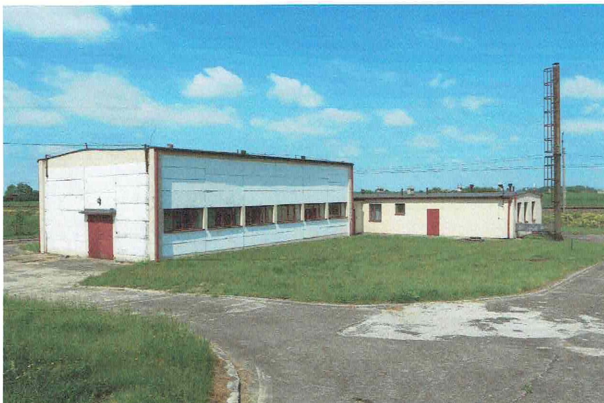
Fot. 1. Ogólny widok budynku.