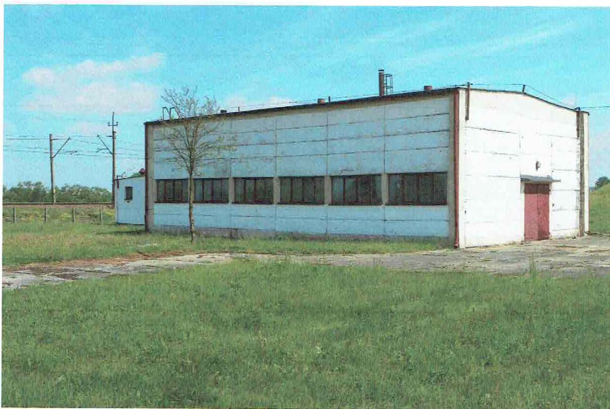
Fot. 4. Ogólny widok elewacji budynku.