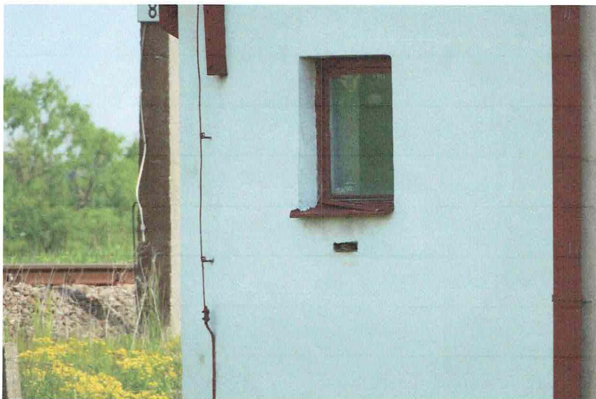
Fot. 5. Ogólny widok elewacji budynku z widocznymi miejscami lęgowymi wróbla.