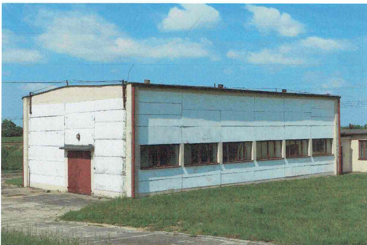
Fot. 2. Ogólny widok elewacji budynku.