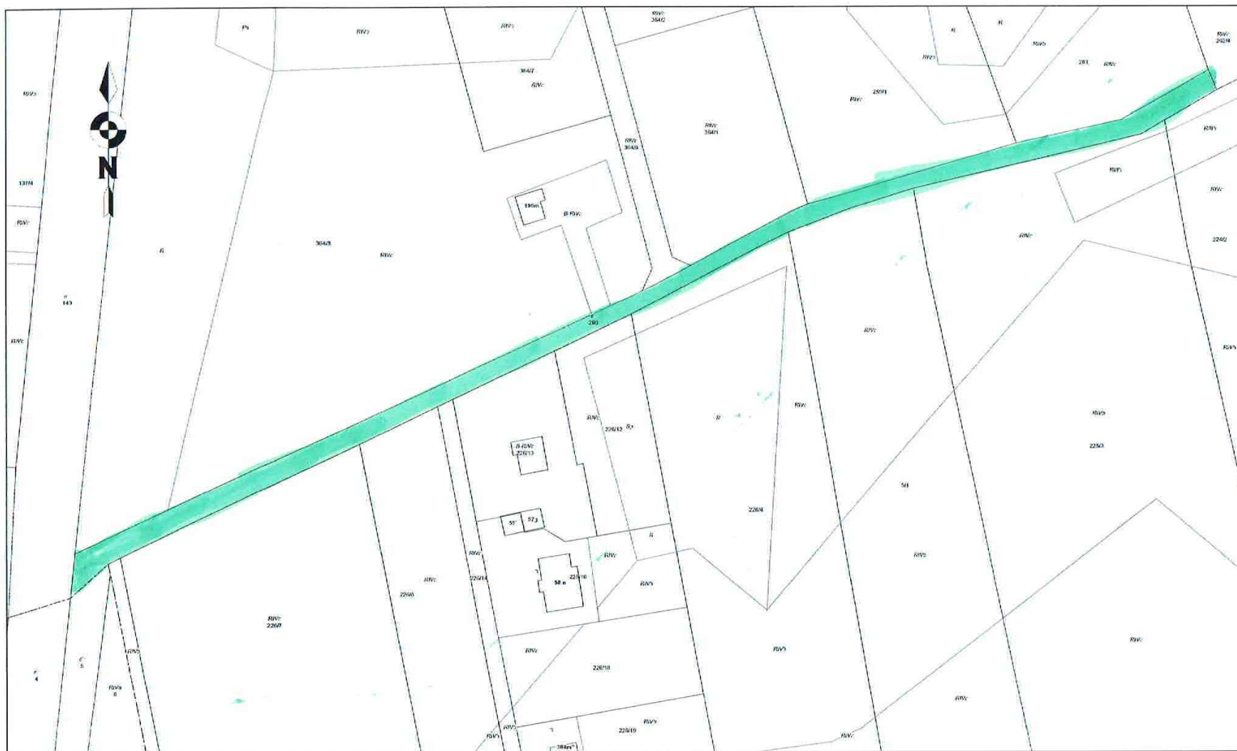
1. WIEŚ: Bielsk – dz. 296/1 i 296/2